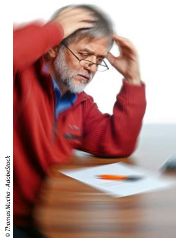
Patienten mit Synkope haben häufig Präsynkopen mit Schwarzwerden vor Augen, Schwindel, Leere im Kopf, etc. ohne Bewusstseinsverlust.